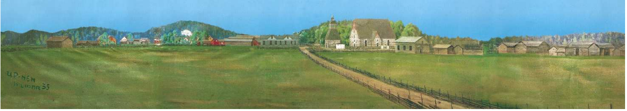
Turvantalon vanha näyttämölavaste, kirkonkylää 1930-luvulla.